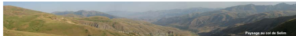
Paysage au col de Selim